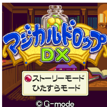
マジカルドロップ

テクモは、本年7月より、東京地下鉄の地下鉄13号線、東京汽船の「さるびあ丸」をはじめとして、「モンスターファーム」のキャラクタータイアップをスタートさせております。今回のジー・モードとの共同プロジェクトもその一環となります。ジー・モードは今後も同様に「モンスターファーム」キャラクターの携帯電話ゲームコンテンツの開発配信を進めていきます。